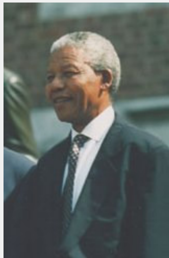
Nelson Rolihlahla Mphakanyiswa (Mandela)

Saltar a navegación , búsqueda Nelson Rolihlahla Mandela (IPA: [roliˈɫaɫa]) ( 18 de julio de 1918 ) fue el primer presidente de Sudáfrica en ser elegido por medios democráticos bajo sufragio universal . Antes de ser elegido presidente fue un importante activista contra el apartheid que, pese a sufrir prisión durante 27 años, estuvo involucrado en el planeamiento de actividades de resistencia armada. Sin embargo, la lucha armada fue, para Mandela, una "última alternativa"; Mandela siempre usó métodos no violentos . Durante su tiempo en prisión (la mayoría de éste, encerrado en una celda en Robben Island ), Mandela se convirtió en la figura más conocida de la lucha contra el apartheid en Sudáfrica. Pese a que el régimen del apartheid y las naciones aliadas a éste lo consideraron junto al Congreso Nacional Africano como un terrorista , su lucha fue parte íntegra de la campaña contra el apartheid. El cambio de políticas contra éste, que Mandela apoyó con su liberación en 1990 , facilitó una pacífica transición a la democracia representativa en Sudáfrica.